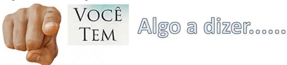
Imagem 2 – Recurso imagético motivacional

O convite foi acompanhado pela seguinte imagem: