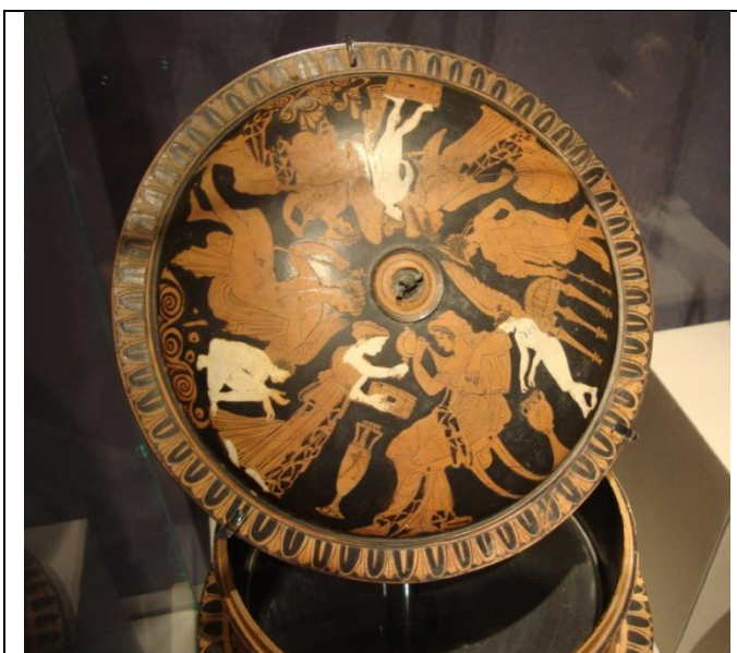
Pyxis con motivos nupciales. 370-360 a.C. Atenas 1630.

La pyxis es una caja pequeña, redonda, que servía para contener cosméticos y artículos de tocador; pertenece sin lugar a dudas al espacio femenino. 3 En la tapa, sentada sobre un klismós , 4 identificamos a la novia con la ayuda de dos signos iconográficos: en primer lugar el gesto de anakalyptéria , 5 el velarse o desvelarse ante el esposo. Y en segundo término los vasos que la rodean, lutróforo y lébes gamikós .