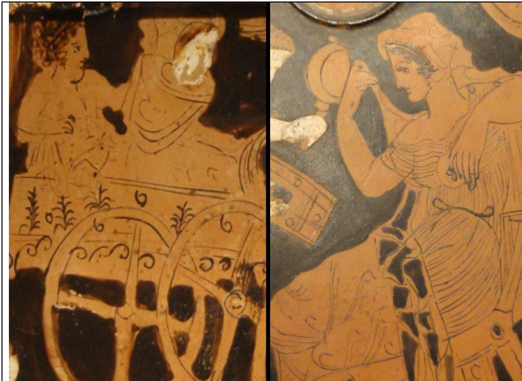
Comparación entre el cuerpo de la caja y la tapa de la pyxis Atenas 1630

Su delicado perfil, el elegante gesto al levantar el velo, el logrado escorzo de su brazo evidencian un artista conocedor de su oficio. El tratamiento de los pliegues cuyos ritmos acentúan las formas de su figura y dejan traslucir los pechos de la mujer contrasta con el manto que envuelve con poca gracia el cuerpo de la novia sobre el carro.