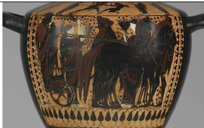
Hidria de Figuras Negras. Desfile nupcial. 520 a.C. Walters Museum of Art 48.33.

presentación de mensajes positivos respecto a la boda, plantearon un repertorio simbólico que fue modificándose de acuerdo a los cambios en la sociedad. En la cerámica de figuras negras –siglo VI a.C. – el motivo predilecto es el de la procesión donde los contrayentes evocan cualidades de los dioses en un ámbito público, celebrado por el conjunto de los habitantes de la ciudad. En la cerámica de figuras rojas –siglo V-IV a.C.– las imágenes de boda se concentran en el ámbito doméstico, íntimo de las mujeres en su gineceo.