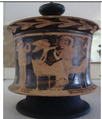
Pyxis de Figuras Rojas. 430 a.C. Preparativos nupciales. Würzburg L541.

Asimismo cambiaron los destinatarios de las piezas: en período arcaico la mayoría de las escenas nupciales se pintan en la vajilla de simposio, por lo tanto están dirigidas a una audiencia masculina que privilegia la ideología patriarcal dominante. Durante el período clásico y post-clásico la iconografía nupcial va paulatinamente trasladándose hacia las cerámicas utilizadas en el tocador femenino. Los conflictos armados de la época comprometieron a la población masculina, muchos murieron y otros estaban tan ocupados en menesteres bélicos que sus esposas debieron asumir tareas que antes les estaban vedadas, por ejemplo, la compra de alfarería. Las exigencias de la nueva clientela modificaron la iconografía a favor de una temática dirigida a las mujeres que pretendían que sus gustos se vieran reflejados en imágenes agradables evocadoras de la ternura que esperaban en sus maridos.